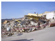
Pensieri stravaganti sulla scuola

Insomma, anche per la religione la scuola deve saper trovare forme di espressione che sappiano accogliere la vita e l'essere degli individui con minore rigidità della ragione scientifica, e di quella filosofico-sistemica o peggio di quella dogmatica, in una pratica antiautoritaria d'insegnamento in cui vi sia il senso di ogni individuo, e specialmente di ogni giovane, come energia positiva, come diritto ad essere se stesso, come diritto alla libertà.