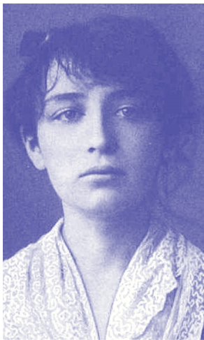
6. La gazza del nord

In questi ultimi anni “la colpa e la grazia, l’inferno e la gloria sono stati i poli della ricerca spirituale di Alda, una ricerca attraversata non di rado dai fulmini di follia che lei non temeva più di rappresentare, “quella follia che la colpì la attraversò anche nel periodo dello strano sodalizio “tarantino” con Michele Pierri.