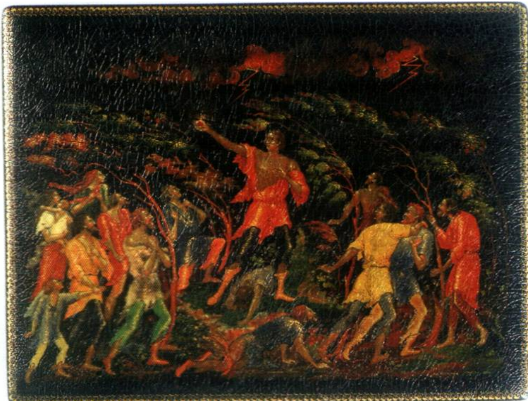
La leggenda di Danko